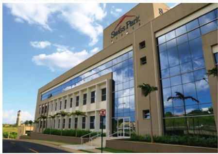
CAMPINAS , Agencia en Brasil