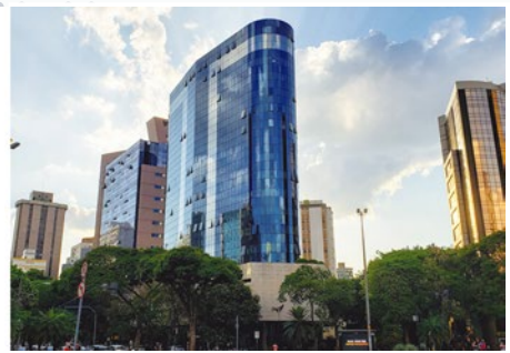
BELO HORIZONTE , Agencia en Brasil