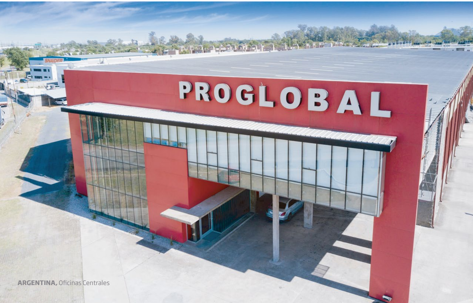
ARGENTINA , Oficinas Centrales